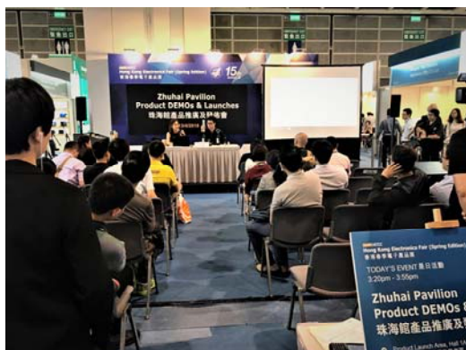
珠海企业产品推介会

商传递新产品信息以及参与“一带一路”建设经验与成果分享。两场推介会现场意向达成多项投资合作项目。