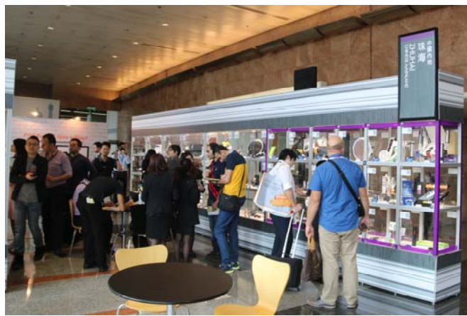
“小批量采购”珠海专区

“小批量采购”珠海专区，助力企业开辟贸易采购新模式。 “小批量采购”珠海专区，是由放置在透明立体陈列柜可供小量采购产品组成。“小批量采购”专区可供 5 至 1,000 件小批量订购的产品，透过跨平台优势，利用贸发网小批量采购网上交易平台，配合实体展会展出，吸引更多买家的新型贸易模式。本次展会珠海经贸团共有 18 家中小企业参加“小批量采购”专区，通过开启线上线下新采购模式，帮助企业开辟贸易采购新模式，开拓全球电子商贸机遇，扩大出口。