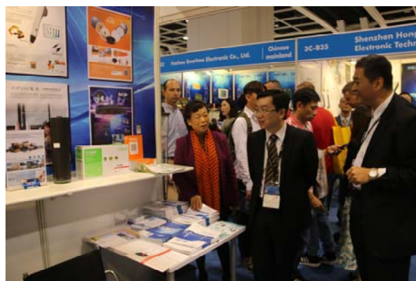
王小彬局长走访珠海参展企业

参展企业踊跃洽谈抢抓订单，成交喜人。 为期 4 天的展会，珠海经贸团参展企业接洽来自香港、日本、韩国、泰国、伊朗、英国、澳洲、美国等国家和地区客商 1601 人，其中老客商 1218 人、新客商 383 人。累计签订 1040 万美元订单和超过 2000 万美元意向合同。