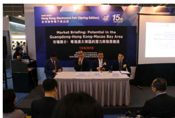
珠海、东莞、惠州三地企业互动交流

市商务局局长王小彬表示，随着粤港澳大湾区加快建设、港珠澳大桥即将通车，我局将深入学习贯彻党的十九大和习近平总书记重要讲话精神，深化落实市委书记郭永航对商务工作“要充分利用港澳资源和优势，借力发展、协力发展、共赢发展”的批示，发挥驻港代表处“建网络、搭平台、引项目”的职能，加强珠港沟通对接，推动珠港经贸合作向更宽领域、更高水平、更深层次发展，携手共促粤港澳大湾区加快建设。